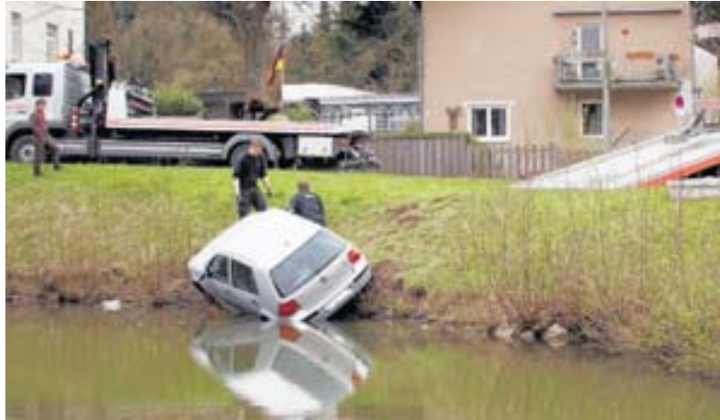
Der Golf eines Kölner Ehepaares rollt führerlos vom Parkplatz in den Goldberger Teich. Zwei Seilwinden sind zur Bergung nötig.